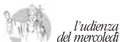
L'udienza del mercoledì

Cari fratelli e sorelle, inizia domani (oggi, ndr) il Triduo pasquale, che è il fulcro dell'intero anno liturgico. Aiutati dai sacri riti del Giovedì Santo, del Venerdì Santo e della solenne Veglia Pasquale, rivivremo il mistero della passione, della morte e della risurrezione del Signore. Questi sono giorni atti a ridestare in noi un più vivo desiderio di aderire a Cristo e di seguirlo generosamente, consapevoli del fatto che egli ci ha amati sino a dare la sua vita per noi. Cosa sono, in effetti, gli eventi che il Triduo santo ci ripropone, se non la manifestazione sublime di questo amore di Dio per l'uomo? Apprestiamoci, pertanto, a celebrare il Triduo pasquale accogliendo l'esortazione di sant'Agostino: «Ora considera attentamente i tre giorni santi della crocifissione, della sepoltura e della risurrezione del Signore. Di questi tre misteri compiamo nella vita presente ciò di cui è simbolo la croce, mentre compiamo per mezzo della fede e della speranza ciò di cui è simbolo la sepoltura e la risurrezione» ( Epistola 55, 14, 24: Nuova Biblioteca Agostiniana (Nba), XXI/II, Roma 1969, p. 477 ). Il Triduo pasquale si apre domani